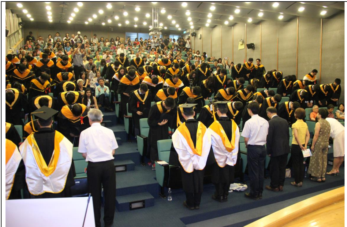
【全體畢業生家長行謝恩禮】