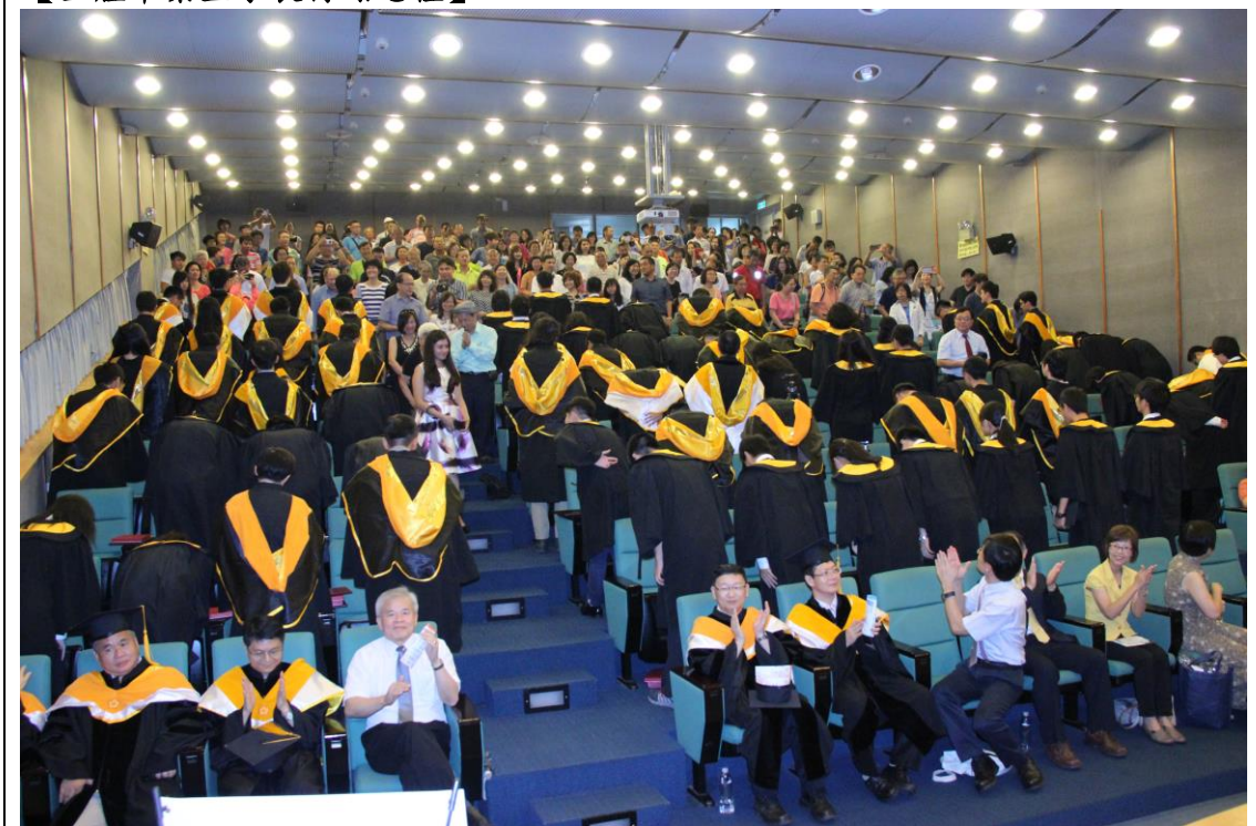
【相道珍重】~相逢自是有緣，期待未來相見~~~