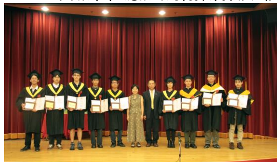
學年度臺灣大學理學院畢業生院長獎頒獎典