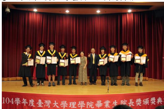
104學年度臺灣大學理學院畢業生院長獎頒獎典