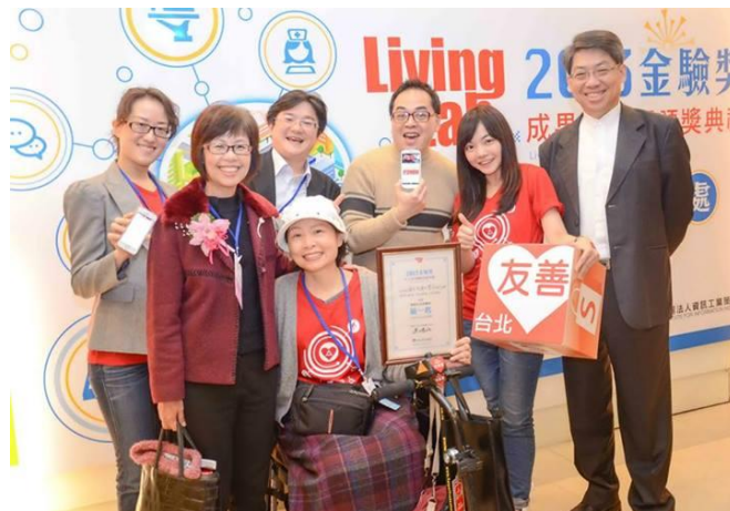
2014 資策會主辦金驗獎評審

此外，周教授擔任許多重要學術學會或專業協會董（理）監事、國際知名學術期刊編輯、科技部評審以及多個政府單位（如環保署、內政部、水利署等）委員，提供專業意見，協助國家社會發展，貢獻良多。今不負眾望的榮獲本校106年教師社會服務傑出獎，實至名歸，本院同賀！