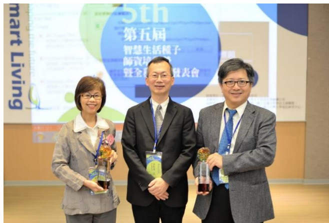
教育部智慧生活整合性人才培育計畫第一期總成果發表會頒獎

畫—「智慧生活整合性人才培育計畫」，推動跨領域人才的培育，以因應我國智慧生活相關產業的人才需求。計畫推動不斷地帶進教育創新的理念。在第一期計畫中曾啟動「亞洲智慧生活國際學院」帶進教育產業國際化的理念與目標，國際學院課程內容著重解決場域(living lab)問題的體驗式學習、並結合台科大設計學院的專長，將服務設計(service design)的概念引入教育學習。國際學院迄今已舉辦四次，有芬蘭 Laurea University、荷蘭 TU Delft、新加坡國立大學、首爾大學、日本東北福祉大學、日本千葉大學、美國哈佛大學、美國夏威夷大學等團隊的參與，荷蘭 TU Delft、新加坡國立大學、首爾大學的設計團隊更是連續四次都有教師帶學生團隊參加，計畫執行成果已讓台科大團隊在國際跨領域的設計教育獲得肯定。去年度更媒合設計與健康照護的議題，由高雄醫學大學主辦國際學院，期待台灣在智慧健康照護的跨領域教育可以在國際教育領域扮演更積極的角色。